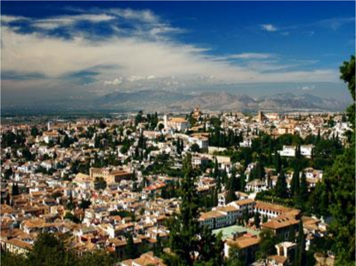
Granada și Muntele Sierra Nevada ▲ ▼