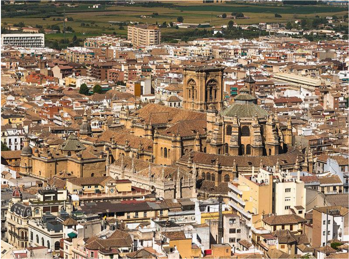
Imagini ale Granadei ▲ ▼